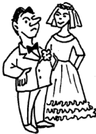
Стал Твер Суринкин